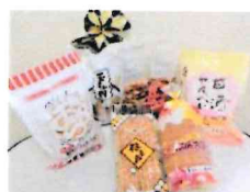
(写真は6種類セット)

★6種類セット 1,490円→会員価格1,200円 (玉子小判・亀甲せんべい・たんさんカルルス・おからせんべい・甘酒せんべい・ピーナッツせんべい)